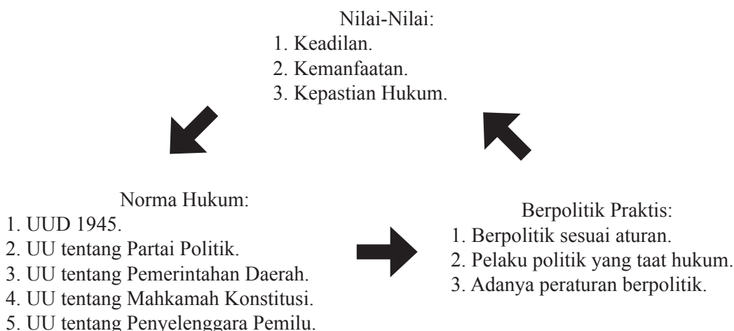
Skema 1. Hubungan Nilai-Nilai dan Norma Hukum dengan Berpolitik Praktis

Pemahaman nilai-nilai dan norma hukum dalam berpolitik praktis pada prinsipnya juga dapat dikatakan sebagai salah satu konkretisasi sistem demokrasi yang diharapkan dapat merubah paradigma masyarakat untuk lebih memperhatikan perkembangan sistem berpolitik serta akibat pengaruh globalisasi dalam berbagai fenomena ketatanegaraan,